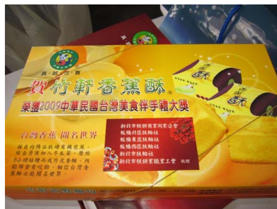
致贈給民眾的紀念品-月餅