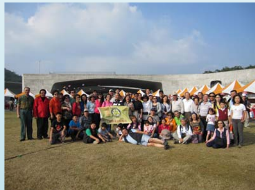
向山行政遊客中心