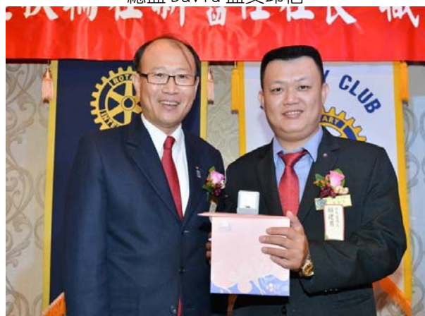
秘書 Hero 致贈卸任秘書 Otoko 紀念品