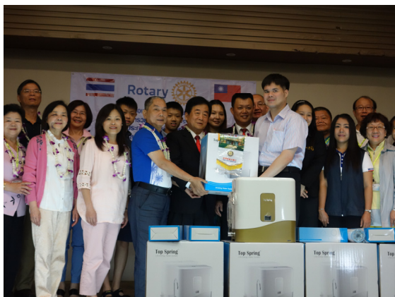
世界社區服務-捐贈生成能量淨水器五台 予泰國弱勢團體