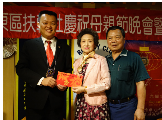
社長 Otoko 頒發 4-6 月份夫人生日禮券