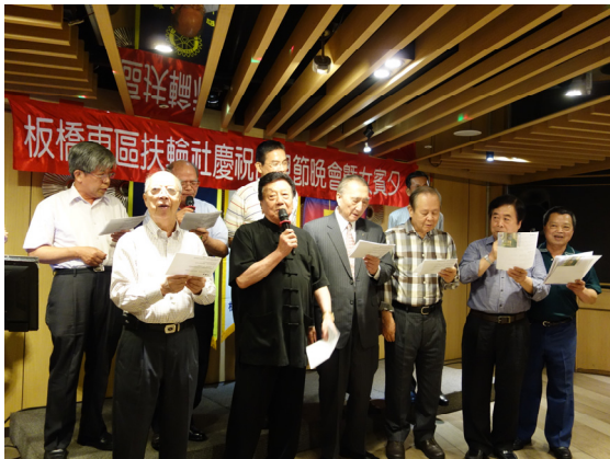
十一位創社社友全體到齊獻唱「月夜愁」