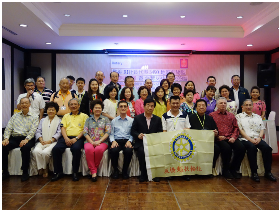
R. I. 社長代表歡迎會

4月27日(星期一)早上九時我們抵達 Chollapratarn 醫院，與泰國當地三個扶輪社 ( Nonthaburi 扶輪社、ParkKret-Nonthaburi 扶輪社、BargKruai-Nonthaburi 扶輪社) 共同舉辦世界社區服務-捐贈五台生成能量淨水機予泰國弱勢團體(自閉症中心、無家可歸收容中心、身障基金會、Cholpratan 醫院、Kruai 醫院)。會中主辦社安排了樂團以泰國傳統歌曲來歡迎我們的到來，四扶輪社也彼此交流擴展扶輪友誼，五個授贈單位也一一表達感謝之意，簡單隆重完成此次來泰國最重要的任務。