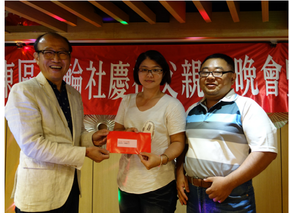
社長 Hero 頒發 7-9 月份夫人生日禮券