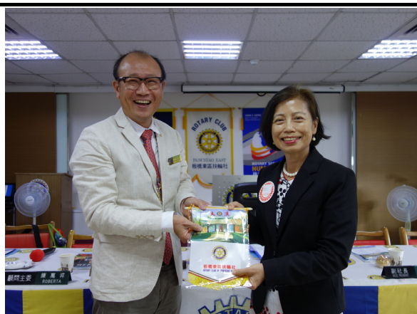
前希臘大使 朱玉鳳小姐