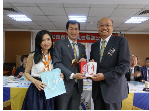
社長 Master 致贈 A. G. Elevator 紀念品