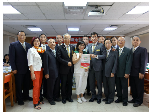
社長 Master、社區主委 Junior 與認養人一同捐贈年度認養金 144,000 元予家扶中心