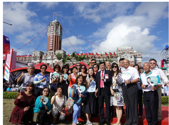
中正紀念堂捷運站前、總統府前廣場合影留念