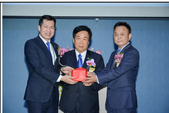
前總監 Trading 監交印信