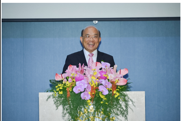
前行政院院長 蘇貞昌致詞