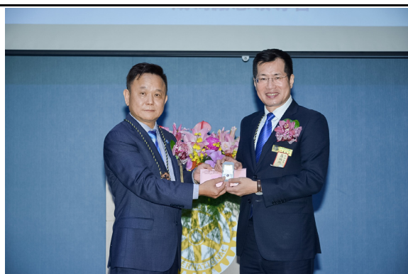
社長 Sky 致贈卸任社長 Master 紀念品