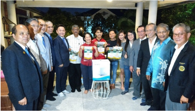
捐贈馬來西亞當地弱勢團體生命能量水生成器五台