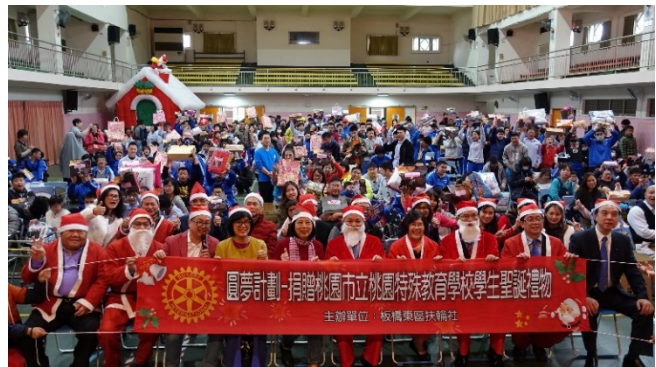
一年一度的幸福約定，讓我們深感施比受更有福