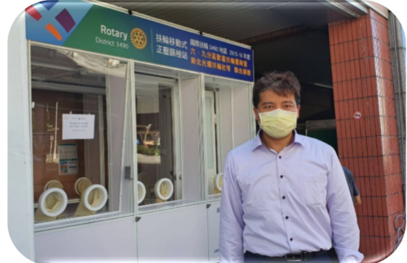
高雄邱外科醫院醫護人員代表感謝本社捐贈