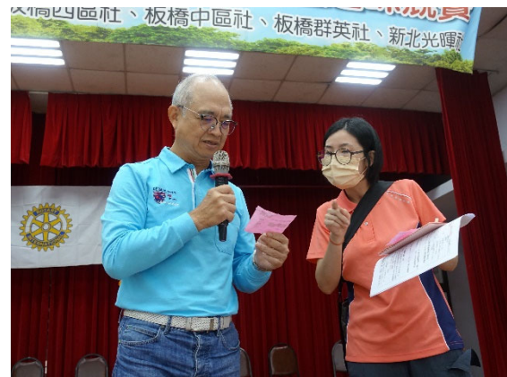
熱鬧趣味的摸彩活動