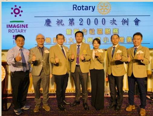
六扶輪社社長與受贈單位合影留念

由板橋北區扶輪社主辦，板橋扶輪社、板橋東區扶輪社、板橋中區扶輪社、新北光暉扶輪社、宜蘭南區扶輪社協辦，聯合捐贈新台幣 180,000 元予德霖科技大學、溪洲國小弱勢學生關懷計劃。希望弱勢學生能安心向學，快樂成長，培養優良品德，成為社會安定力量的來源。