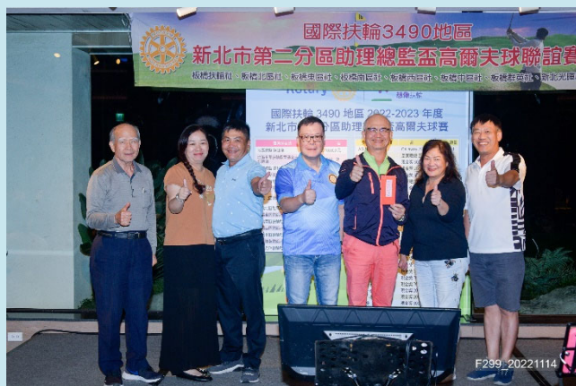
榮獲 AG 盃-團體賽亞軍