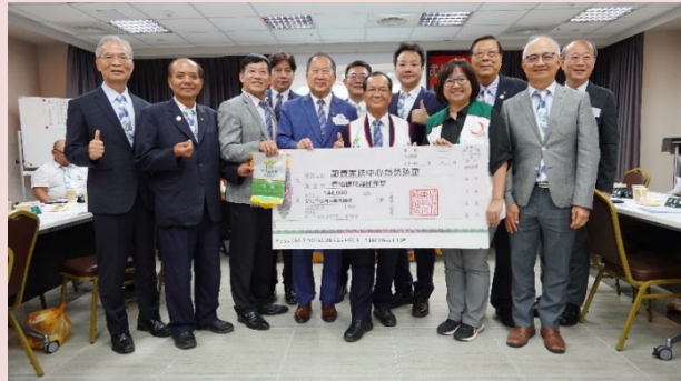
社區服務-認養新北市家扶中心 12 位弱勢家庭孩童